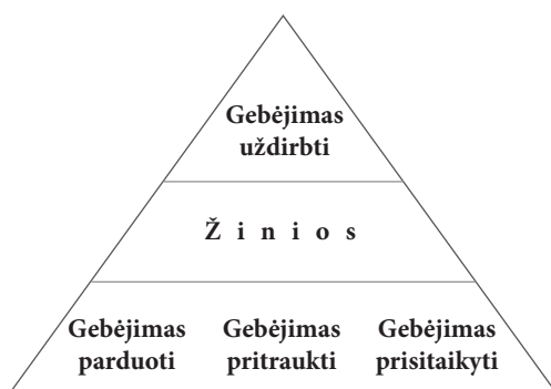
2 pav. Šalies konkurencingumo hierarchija (Trabold 1995)