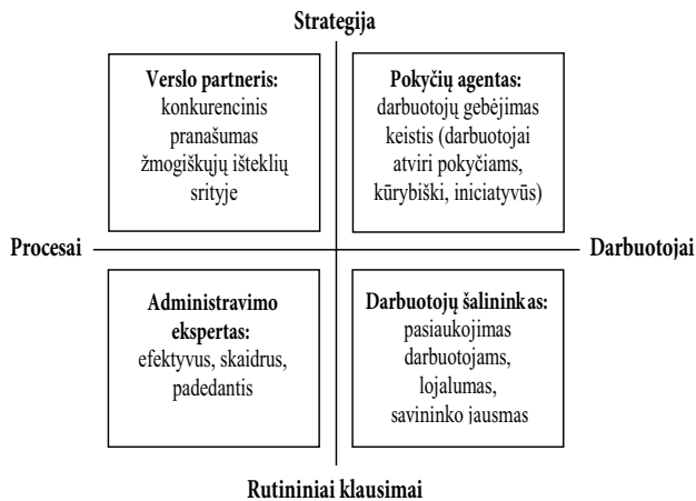
1 pav. D. Ulricho kvadratas (Ulrich, Brockbank 2007)