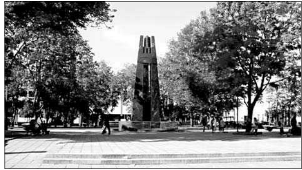
4 pav. Kudirkos paminklas Savivaldybės aikštėje