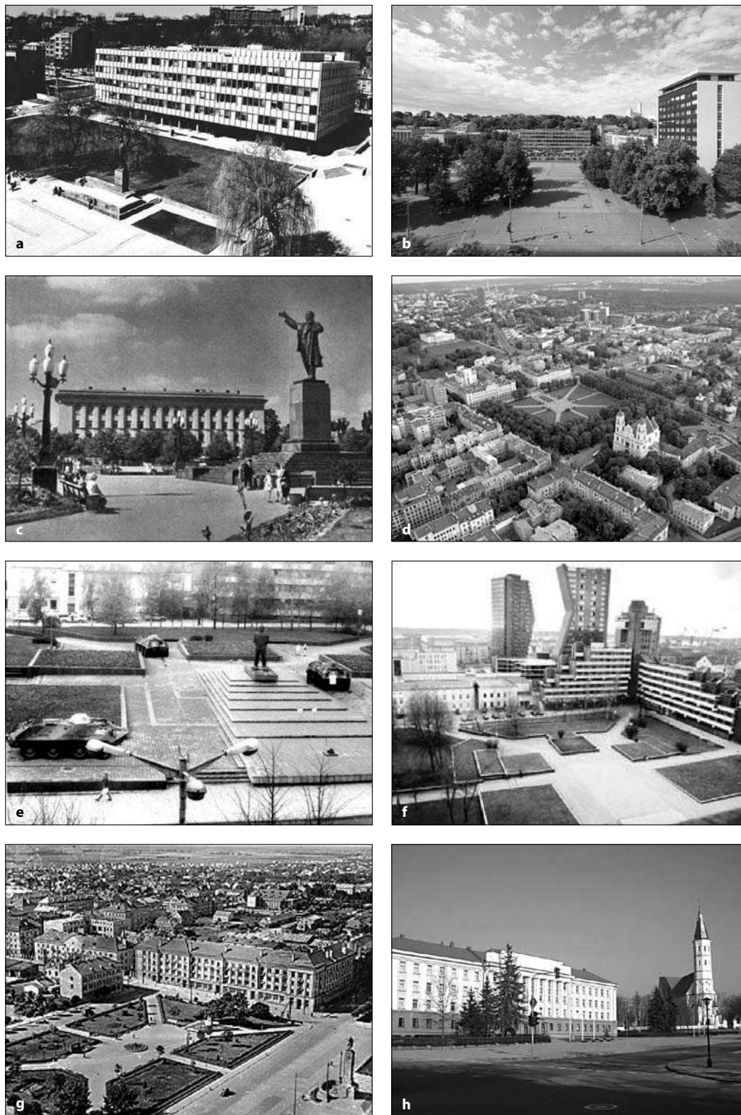
2 pav. Pagrindinių reprezentacinių miesto viešųjų erdvių transformacijų pavyzdžiai: a, b – Vienybės (buvusiojo Janonio) aikštė Kaune; c, d – Lukiškių (buvusioji Lenino) aikštė Vilniuje; e, f – Atgimimo (buvusioji Lenino) aikštė Klaipėdoje; g, h – Prisikėlimo (buvusioji Pergalės) aikštė Šiauliuose