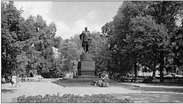
3 pav. Černiachovskio antkapinis paminklas aikštėje apie 1980 m.