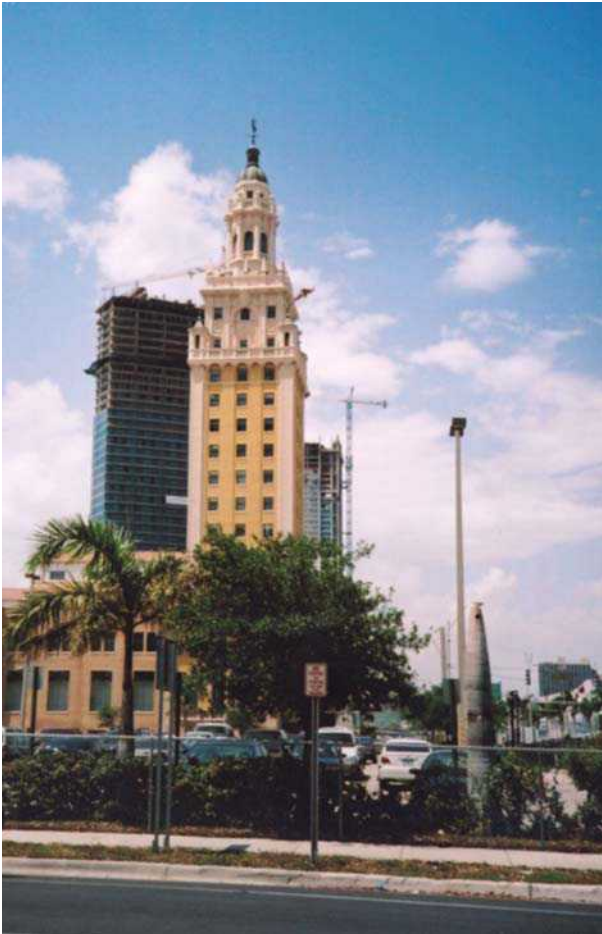
2 pav. Floridos „Laisvės rūmo“ respektavimas. Ekspozicinio (respektavimo) fono kūrimas, didinant tamsaus foninio statinio aukštį Fig 2. Respect of Freedom Palace in Florida. Formation of expositional (respect) background by increasing the height of obscure building in the background