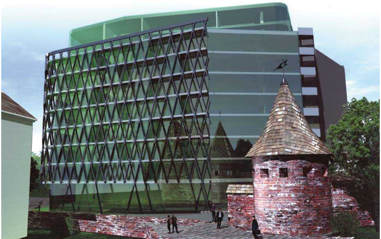
5 pav. Kauno miesto gynybinės sienos ir bokšto vizualinio eksponavimo gerinimas naujai statomo pastato, kaip ekspozicinio fono, reflektavimo efektais