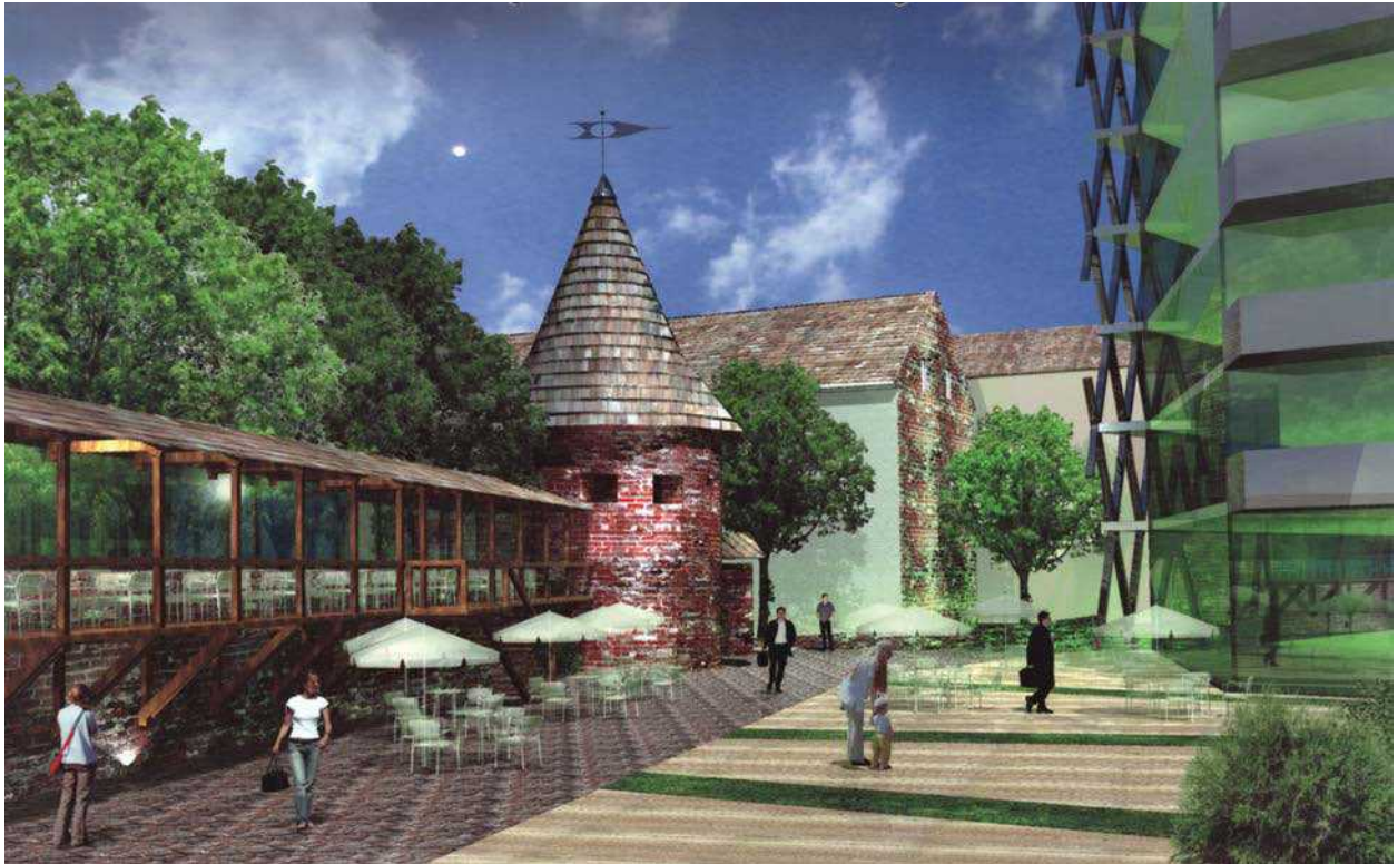
4 pav. Kauno miesto gynybinės sienos ir Malūnininko bokšto vizualinis ir mentalinis paviešinimas, suteikiant vietai ir objektui viešojo naudojimo funkciją