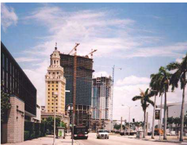
3 pav. Floridos „Laisvės rūmo“ eksponavimo gerinimas artimesnio ekspozicinio fono reflektavimo efektais (kairėje) Fig 3. Freedom Palace in Florida. Improving the Palace exposition by reflective effects of closer expositional background (on the left)