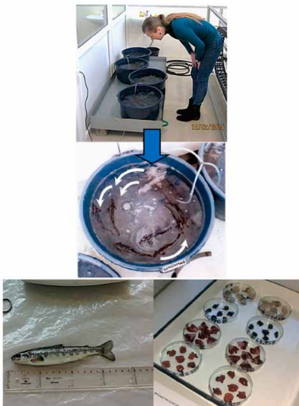
1 pav. Žuvų ekspozicija ir audinių paėmimas Fig. 1. Fish exposure and tissue sampling

Žuvų fiziologinei būklei įvertinti buvo apskaičiuoti kontrolinių ir bandymo žuvų morfologiniai rodikliai: imitimo koeficientas ( IK ) ir organų somatiniai indeksai ( OSI ): visceralinis ( VSI ), žiaunų ( ŽSI ), kepenų ( KSI ) ir inkstų ( ISI ).